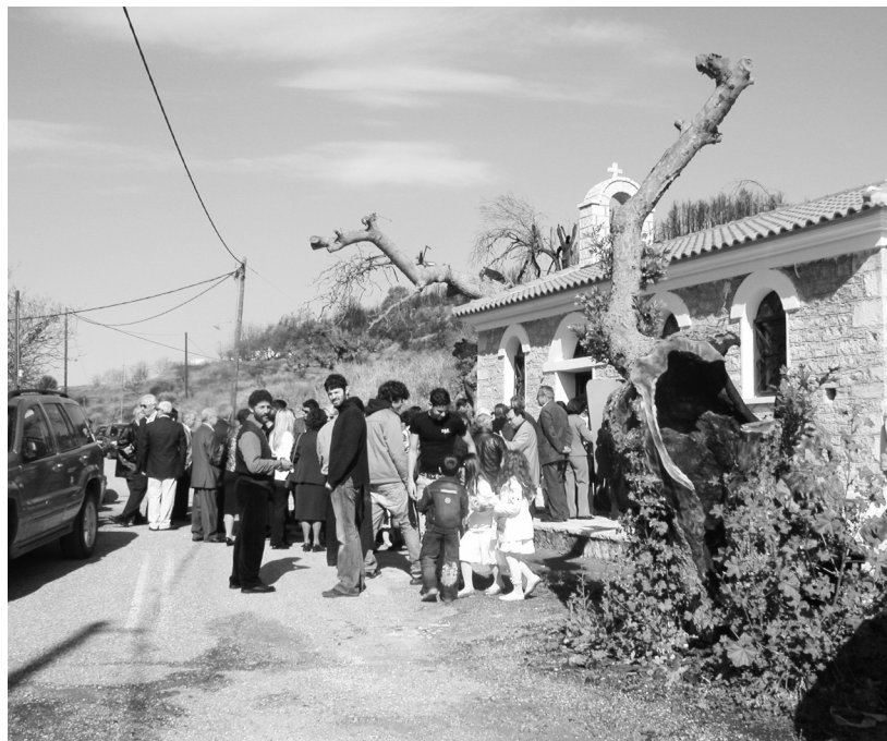
Στη γιορτή του Αγίου Γεωργίου

να μείνουν στις πόλεις, να γιορτάσουν σε άλλα μέρη ή στα εξοχικά τους, ενώ κάποιοι άλλοι πήραν μαζί τους τους ηλικιωμένους γονείς, οι οποίοι ζουν στα κοντινότερα.