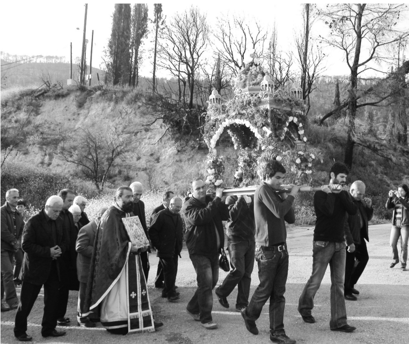
Η περιφορά του Επιταφίου

θα και στην Τρυγόνα διέλυαν στη στιγμή την όποια ψευδαίσθηση τέρψης του βλέμματος και της ψυχής. Άφηναν μια βαθιά μελαγχολία, μια πίκρα για την τόση ομορφιά που χά-