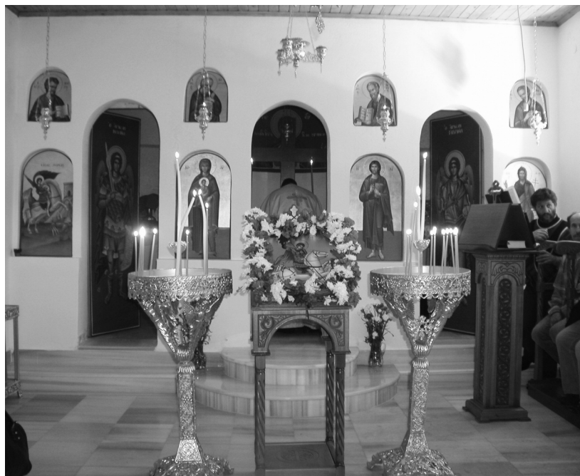
Η ανακατασκευασμένη εκκλησία του Αγίου Γεωργίου

Για όσους βρεθήκαμε εκεί η απουσία τόσων ανθρώπων ήταν έντονη. Πρώτα-πρώτα εκείνων που χάθηκαν για πάντα στην πυρκαγιά. Αλλά και η απουσία εκείνων που δεν ήρθαν και που όλοι αυτοί μαζί συνέθεταν το Πάσχα στη Μάκιστο, πρόσθετε στη μελαγχολία μας. Κανείς δεν σούβλισε, κανείς δεν γλέντησε. Αλλά και στην Αρτέμιδα, «άκρα του τάφου σιωπή...» και στη Μηλέα ή στις Τρύπες, το ίδιο βαρύ κλίμα.