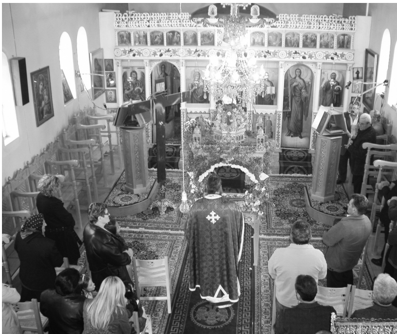
Επιτάφιος. Στασίδια άδεια...

Οι λιγοστοί μόνιμοι κάτοικοι της Μάκιστου περίμεναν να έρθουν τα παιδιά τους, συγγενείς και φίλοι, κάτι που συνηθίζονταν τούτες τις μέρες. Ειδικά φέτος, το είχαν μεγαλύτερη ανάγκη για να μπορέσουν να αναπαρηρθούν λιγάκι, να αντέξουν. Όμως, δυστυχώς, η προσέλευση ήταν η μικρότερη από κάθε χρονιά. Κάποιοι συγχωριανοί μας δεν ήρθαν αφού τα σπίτια τους κάηκαν και δεν είχαν πού να μείνουν. Άλλοι δεν αντέχουν την εικόνα και προτίμησαν